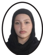
Medine Nur Bitik Gazetecilik Öğrencisi

Kadınlarımız, Cumhuriyetimizin parlak geleceğidir. Her alanda eşit haklarla var olabilen bir toplum, tüm insanlık için daha güçlü ve adil olacaktır.