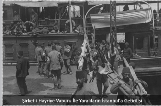
Şirket-i Hayriye Vapuru ile Yaralıların İstanbul'a Getirilişi