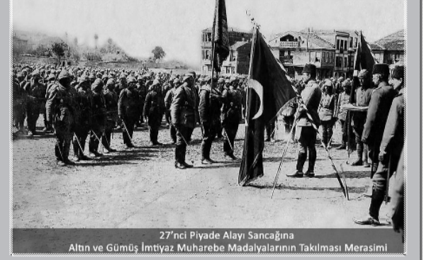
27'nci Piyade Alayı Sancağına Altın ve Gümüş İmtiyaz Muharebe Madalyalarının Takılması Merasimi