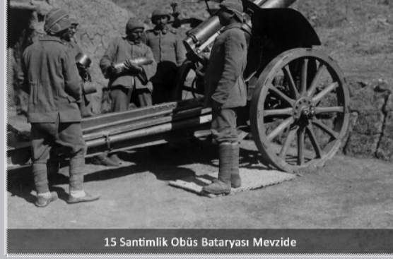
15 Santimlik Obüs Bataryası Mevzide