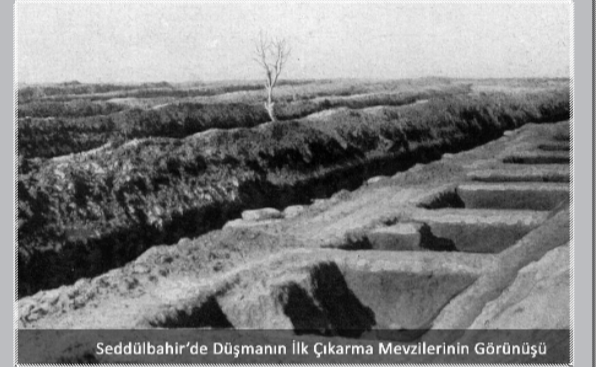
Seddülbahir'de Düşmanın İlk Çıkarma Mevzilerinin Görünüşü