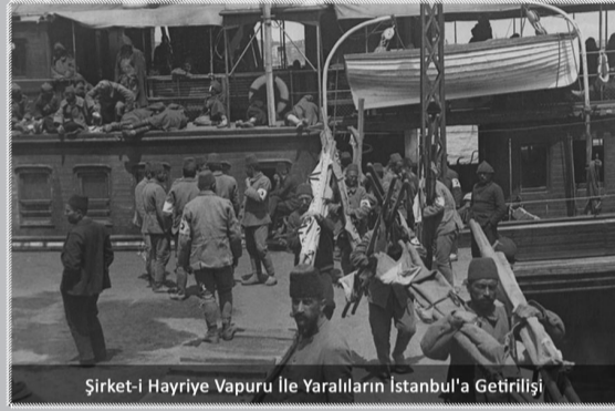
Şirket-i Hayriye Vapuru İle Yaralıların İstanbul'a Getirilişi