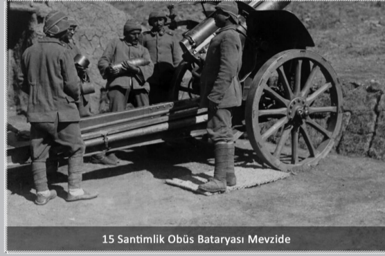
15 Santimlik Obüs Bataryası Mevzide