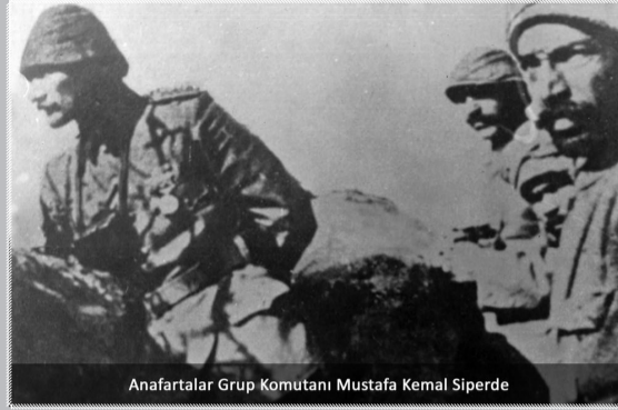
Anafartalar Grup Komutanı Mustafa Kemal Siperde