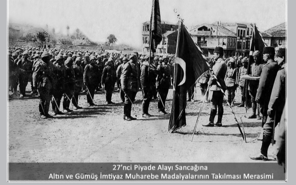
27'nci Piyade Alayı Sancağına Altın ve Gümüş İmtiyaz Muharebe Madalyalarının Takılması Merasimi