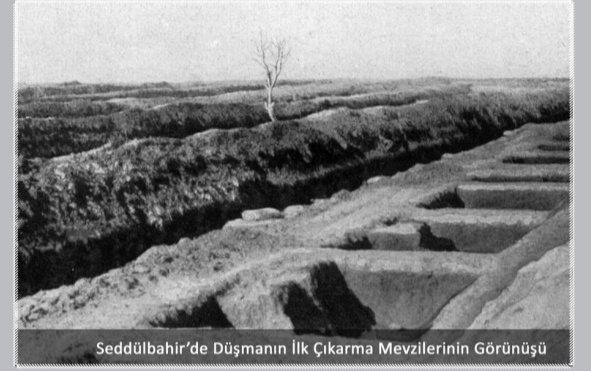
Seddülbahir'de Düşmanın İlk Çıkarma Mevzilerinin Görünüşü